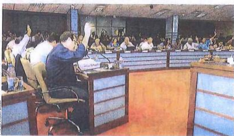
Le mille-feuille de la fiscalité indirecte actuelle est obsolète et facilite l'opacité, raison pour laquelle les élus du Congrès de tout bord ont fini par voter à l'unanimité la loi instaurant la TGC.

Plusieurs formations, dont l'UC, l'UCF et Les Républicains, se sont en effet inquiétées du risque inflationniste pesant sur les activités de services (restaurants, crèches, aides à la personne, artisans, etc.). Actuellement ces secteurs sont assujettis à la TSS dont le taux est de 5 %, et que la première mouture du projet plaçait dans le taux intermédiaire