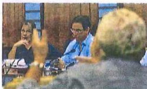
L'examen du texte sur la Compétitivité a donné lieu à une passe d'armes entre les bancs des Républicains et de Calédonie ensemble.